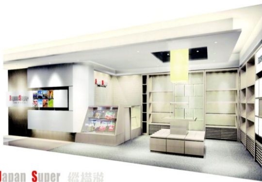
Japan Super 縦横遊 スーパーマーケット

開店当日は、店舗に隣接する「旅行説明会場」のお客様が来店されたほか、ほくとう戦略会議の会長である青森県三村知事他もご視察されました。